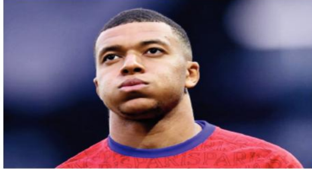
النادي الملكي، لأن بيريز لا يريد التعيل لإبرام الصفقة، ويريد أن يحتفظ بعلاقات جيدة مع إدارة باريس سان جيرمان،

جدير بالذكر أن مبابي شارك مع باريس سان جيرمان في 43 مباراة خلال الموسم المنقضي 2022-23، ونجح في تسجيل 41 هدفا وصناعة 10 أهداف أخرى.