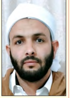
بصائر الأستاذ: الأخضر عالب

فقدت الجزائر عموما ومدينة مسعد خصوصا، يوم الأحد الماضي 07 ذي الحجة 1444هـ/25 جوان 2023م، العلامة الشيخ أحمد بن الطاهر سعيد، وهو أحد رجالات الحركة الإصلاحية والفكرية بالمنطقة، وأحد خريجي المعهد الباديسي والجامع المعمور الزيتونة بتونس، نال شهادة الليسانس في التاريخ بجامعة بغداد سنة 1962م، وهو من الأساتذة الأوائل في تاريخ الجزائر المستقلة، وقد رحل الشيخ رحمه الله في صمت رهيب، ومن أجل كسر هذا الصمت وإعطاء حق هذا الرجل من الوفاء والتقدير والتذكير بفضائله، يأتي هذه المقال لرد الاعتبار لأحد علماء جمعية العلماء المسلمين بمنطقة مسعد وأحد أعلام الجزائر، لعلنا بذلك نرد ولو بشيء القليل من العرفان لهذا الشيخ والمنطقة مسعد العامرة.