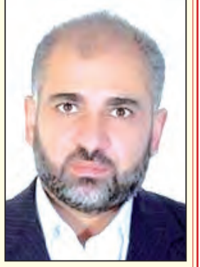
بقلم د. مصطفى يوسف اللداوي

عندما تكون سارية الخيمة عالية وعمادها متينة وأوتادها قوية وجلوذها سمكية وأوبارها كثيفة، وبناتها مهرة، ونصابها أصحاب تجربة وأهل خبرة، وحراسها فرسان ذوو شهامة ونخوة، لا تهزها الرياح، ولا تسقطها العواصف، ولا تحرقها السيول، ولا يشعر سكانها بالبرد.