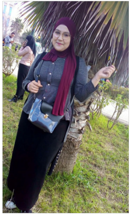
حاورها / أ. لخضر . بن يوسف

بالنسبة للأفكار التي تطرقت إليها في كتابي لحظة اعتراف، فقد تنوعت رغم صحتها في نفس المعنى، ألا وهو رؤية الجانب المعتم في قلب كل شخص، بعيدا عن الشكل والميول أو الحقيقة الظاهرة أمامنا.. ومن جهة عدم إطلاق الأحكام أو تعميم حكم قاس على الأفراد...دون معرفة ما تخفيه أفئدتهم وما شهدته أرواحهم..لذلك فقد تحدثت في القصص على التوالي عن زواج القاصرات، ورواية تتعرض لما يسمى "الواسطة" أو الأفضلية لصالح شخص آخر، مجهول نسب