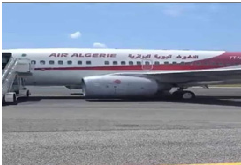
طاقم الجوية الجزائرية يهبط بسلام بمطار روما بعد انفجار إطارات الجهة اليسرى..