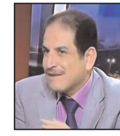
■ بقلم: ماجد الخواججا

العيد هو فرح عفوي بسيط بمتطلبات متواضعة، لكنها تكفي لإشاعة مناخ من الفرح والرفق بين الناس. نحن من ألقنا على العيد وعلى أنفسنا في متطلبات لا رابط بينها هناك من يقول أن أجمل ما في العيد انتظاره، وأجمل ما في السفر الطريق، ويبدو أن الاستعداد والتحضير للعيد له من الشغف والشوق والحماسة أكثر من العيد نفسه. ثمة تفاصيل وشؤون كثيرة التصقت بالعيد الكبير وفي مقدمتها الأضحية حيث يسمى العيد بعيد اللحم، أما الكعك البيتي الذي تفوح روائحه في أرجاء الحارات فهو ملازم للعيد. فيما تجيء صلاة العيد فاتحة النهار وكاشفة النفوس ومشرعة القلوب.