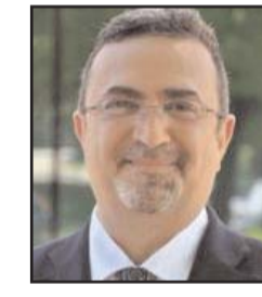
■ بقلم: بشار جرار

الفرز والهلع من التحزب والتحزب المضاد، الذي جعل النقيضين على حال واحد في كثير من البلدان العربية التي عصفت بها ما نجانا الله منه، بفضل قيادتنا الهاشمية ومعدن عشائرتنا وأسرتنا العريقة الأصلية الطبية. في عالم دائم الحركة وبياقع أكثر تسارعا، لا تستقيم الحيوات ومنها الحياة السياسية دون اعتماد آليات وضوابط وروافع للعمل السياسي الذي هو حق لا ترف، تماماً كما هو العمل الاقتصادي والاجتماعي. الحقوق كما الواجبات لها مدخلات ومخرجات. لديهم وسط ووسيط، لا تكتمل فيه معادلة التفاعل ولا تتضج إلا من خلال المناخ الداعم الكفيل برعاية حالة صحية من العمل والثقة، تستبدل كل ما مضى من أساليب ومفاهيم بالية، لا بالتقدم، ولكن