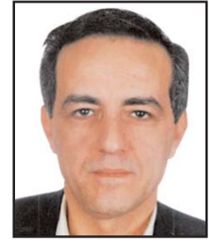
■ بقلم: صباحي غندور

أمريكا اللاتينية وأفريقيا وشرق آسيا ودول العالم الإسلامي كانت تزداد بشكل واسع خلال العقود الماضية، علماً أن غالبية المهاجرين من أمريكا اللاتينية هم من أتباع المذهب الكاثوليكي بينما من هم «أصول أمريكا» يتصفون بـ«الواسب» WASP والتي تعني «البييض الأنجلوسكسون البروتستانت»، وهم الذين مارسوا العبودية بأعنف أشكالها ضد الأفريقيين المستعمرين للقارة الجديدة، إلى حين تحريرهم قانونياً من العبودية على أيدي الرئيس أبراهام لنكولن في نهاية القرن التاسع عشر، بعد حرب أهلية طاحنة مع الولايات الجنوبية التي رفضت إلغاء العبودية في أمريكا. فالتمييز الديمغرافي الحاصل في المجتمع الأمريكي، والعنصرية العرقية المتجددة، والهجرة لأمريكا من أديان ومذاهب وثقافات مختلفة عن «الأصول الأمريكية» كانت هي وراء فوز ترامب في العام 2016، وهي مستمرة الآن كقوة دعم له فإرضة نفسها على الحزب الجمهوري وعلى أعداد كبيرة من المستقلين غير الحزبيين.