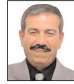
■ بقلم: حمادة فراغنة

التنسيق الأمني بين رام الله وتل أبيب، والتهديئة الأمنية بين غزة وتل أبيب، وإن اختلفت الإجراءات بين هذا وذاك، أما التسلط والأحادية فهي عناوين السلوك السياسي التنظيمي من كليهما ضد الآخر، مما يشير إلى حصيلة محبطة، أو هكذا هي النتائج، لا مناص من التهرب منها أو مواجهتها، مظاهرها بائنة فاقعة، مذلة نفسياً، قاسية معنوية، ومع ذلك، تتوفر مظاهر بديلة؟؟ ما الذي يجري شعبياً في مواجهة هذه العوامل الفلسطينية السلبية، وما هو السائد في مواجهة المستعمرة من عوامل مستجدة؟؟