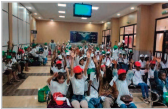
لؤي . ع

انطلقت أولى الرحلات ضمن برنامج المخيمات الصيفية المبرمجة لهذا الموسم لفائدة أطفال ولاية تمنراست بالمدن الساحلية، حسب ما علم أمس الأحد من مسؤولي قطاع الشباب والرياضة بالولاية. وأوضح المدير الولائي للقطاع، حساني مولاي عبد الكريم، بأن هذا الفوج الأول الذي انطلق ليلة أول أمس من مطار تمنراست يتكون من 200 طفل من مختلف بلديات الولاية متوجهين مناصفة نحو وهران ومستغانم، حيث سيستفيدون من برنامج ترفيهي لمدة 12 يوما. وأشار إلى أن 1000 طفل من الولاية سيستفيدون من برنامج هذا المخيم الصيفي بكل من وهران ومستغانم، مقسمين على 5 دفعات تحصي كل دفعة 200 طفل. ومن المنتظر أن يتم مرافقة الأطفال وتأطيرهم من