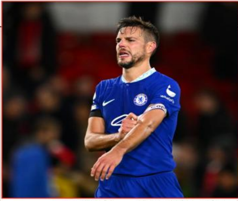
يسجل أو يصنع أي هدف، وتلقى 04 بطاقات صفراء.