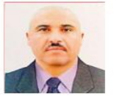
لتركك بعد الرحيل شينا في الحياة لك فيه أثر.

وتسرد الهزوجة الكمبورتية كمبورتية لا ما علفتي بالحطب باجيب لك عود السمير مرة رأى فيه جسدا آخر تحت اضاءة التنور تعجزت بخيطة لا حياة الليل الادهشته وصقاه