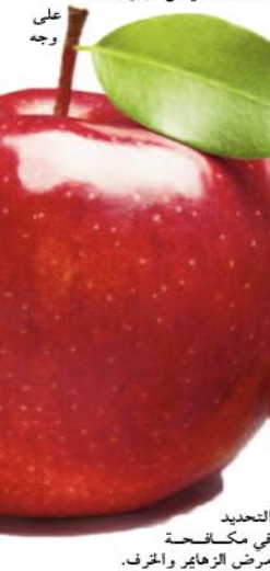
التحدي في مكافحة مرض الزهايمر والخرف. خفض الكوليسترول يمكن أن تؤدي إضافة القليل من التفاح إلى النظام الغذائي إلى الحفاظ على صحة القلب بشكل ملحوظ. وفقًا لدراسة أجريت عام 2019 ونُشرت في دورية "Nutrients"، فإن تناول التفاح يقلل من مخاطر الإصابة بمرض السكري من النوع 2. إن تناول تفاحة بين الحين والآخر يمكن أن يكون أسهل طريقة للحفاظ على قياس

9. تحسين راحة النوم بدأ من الإمساك بفرشاة الأسنان فورًا بعد تناول التفاح، ينصح الخبراء بتناول التفاح، حيث كشفت دراسة، نُشرت عام 2016 في دورية "Food Science"، أن تناول تفاحة بعد تناول التفاح يمكن أن يقلل بشكل كبير من الانزعاج الموجودة في النوم التي تعزز راحة النوم الكريمة.