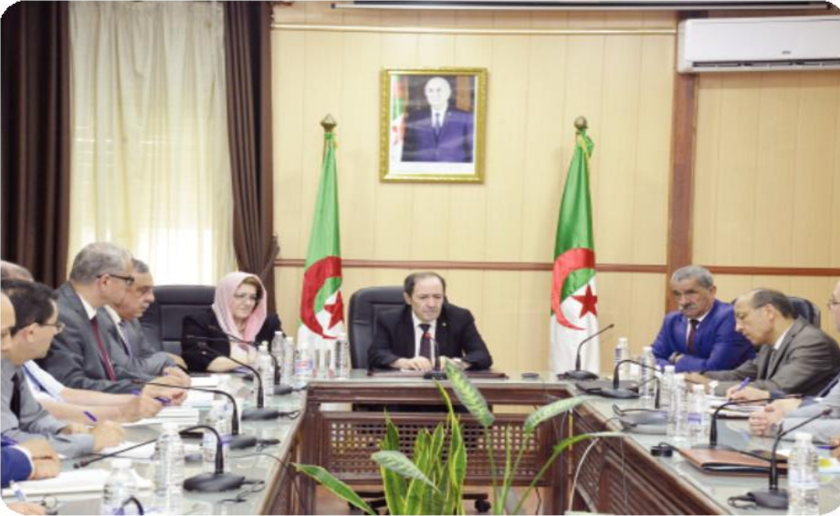
تحلية مياه البحر:

عرقاب يقف على اللمسات الأخيرة لوضع محطة قورصو حيز الخدمة قريبا