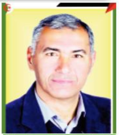
يقلم: عبد الناصر فروانة

قال نادي الأسير، إن جريمة التعذيب وسوء المعاملة يشكلان إحدى أبرز الجرائم المنهجة، والثابتة التي تتهمها سلطات الاحتلال الإسرائيلي بحق الأسرى، وذلك عبر سياسات وأساليب وأدوات مختلفة. وأضاف نادي الأسير، بمناسبة اليوم العالمي لمناهضة التعذيب، الذي يصادف اليوم، 26 من حزيران من كل عام، أنه منذ مطلع العام الجاري ومع تصاعد مستوى المقاومة ضد الاحتلال، صدقت سلطات الاحتلال من ممارسة التعذيب، بمستوياته المختلفة، وذلك في محاولة منها لتقويض حالة المقاومة المستمرة، هذا إلى جانب جملة من الجرائم. وأشار إلى أن سلطات الاحتلال عملت على ابتكار سياسات، وسياسات على مدار العقود الماضية، لاستهداف الأسرى جسدياً ونفسياً، واتخذت هذه الجريمة حيزاً أساسياً في رواية الأسرى عن تجربة الاعتقال. وأوضح أن الاحتلال صعد كذلك من إصدار أوامر منع من لقاء الجائمين، إضافة إلى منهج التحقيق الطويلة التي تجاوزت البعض منها أكثر من شهر، بشكل متواصل، ولم تستثن أيًا من الفئات (النساء، والأطفال، وكبار السن، والمرضى) بما في ذلك الجرحى، وتابع نادي الأسير، إن سياسة التعذيب المنهجية، لم تعد تقتصر على الفهم المتعارف للتعذيب وفقاً للقانون الدولي، إذ أوجدت أجهزة الاحتلال بمستوياتها المختلفة أساليب وأدوات حديثة لعمليات التعذيب، وعلى الرغم من أن هذا الفهم ارتبط بفترة التحقيق، إلا أن هذا لا يعني أنها الجملة