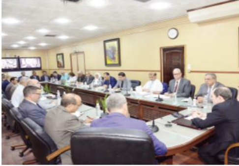
التربية لكل مؤسسة لتتضمن مشاركتهم مع إطارات مديريات الإجازات الحقيقية، وحتم ذلك على التربية في هذا اليوم ميدانيا.

ترأس وزير التربية الوطنية، الأستاذ عبد الحكيم بلعابد، السبت، ندوة وطنية عن طريق التحاضر المرئي من مقر الوزارة بالمدية، حضر أشغالها إطارات من الإدارة المركزية، ومدير التربية، حسب بيان للوزارة.