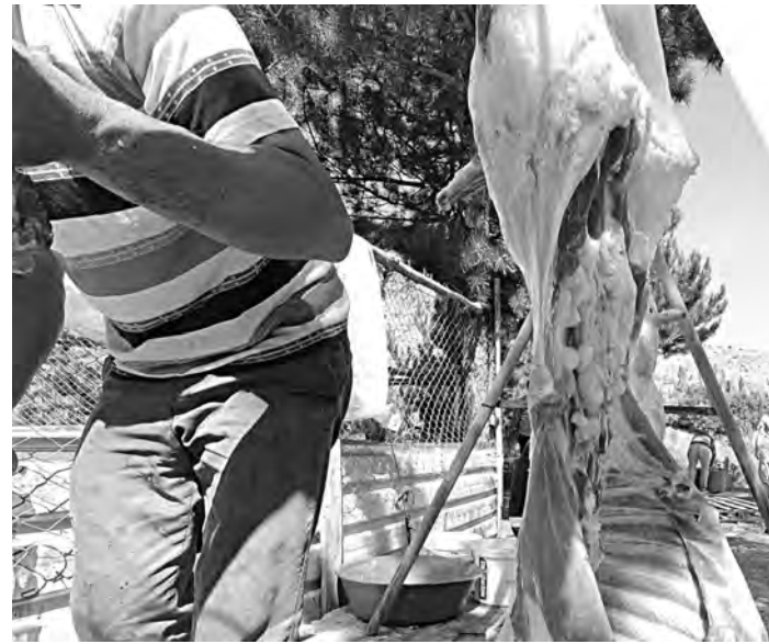
أجواء مميزة بوجعيريج