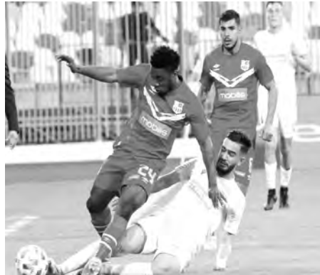
التشويق، لكن في غياب الجمهور. م. عبد الكريم

الكأس أمام منافسهم اليوم؛ الأمر الذي سيزيد الإثارة وعامل