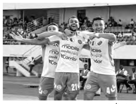
التشكيلة ثلاث مباريات ودية، وهو ما سمح للمدرب بوزيدي بالوقوف أكثر على مدى جاهزية لاعبيه؛ من

تطلعات الأناصر. وكان الطاقم الفني برمج تربيصا قصبيا بالعاصمة؛ حيث أجرت