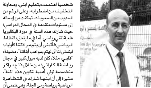
مصاب بطيف التوحد من ولاية البلدية، فإن التكفل بالأطفال المصابين بطيف التوحد يُلقى على عاتق الأولياء، موضحة: "أنا