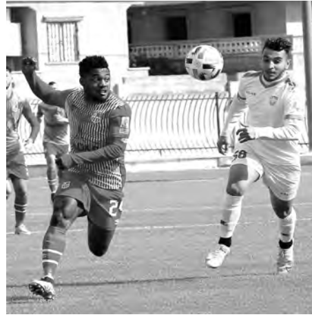
المقبل، في حين أن بارادو صاحب المركز ما قبل الأخير، فلا خيار له سوى الفوز إن أراد تمديد تواجده في

أمل الأرياء - اتحاد العاصمة نجم مقرة - شباب قسنطينة شباب بلوزداد - جمعية الشلف (بدون جمهور) مولودية وهران - مولودية البيض اتحاد بسكرة - اتحاد خنشلة شبيبة الساورة - شبيبة القبائل مولودية الجزائر - هـ. شلفوم العيد وفاق سطيف - نادي بارادو ملاحظة: كل المباريات تنطلق على الساعة الخامسة مساء