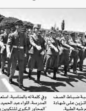
الثامنة للطلبة ضباط الصف المتعاقدين الحائزين على شهادة "ليسانس" في العلوم شبه الطبية.

العلمية والعسكرية الملقنة لفائدة المترصين والطببة من طرف مدرين مؤهلين وأساتذة أكفاء، بأرقي المناهج والوسائل البيداغوجية التي وفرتها القيادة العليا للجيش الوطني الشعبي مما سميكتهم من أداء مهامهم النبيلة بكل احترافية. كما دعا المتخرجين إلى "بذل أقصى الجهود بعد اقتحامهم الواقع العملي وإعطاء المثال في العمل الميداني للدفاع عن سيادة الوطن وأمنه واستقراره لتكون تلك النتائج الملموسة حافزاً للمدرسة لتبليغ مستويات أرقى. ويعد أداء القسم من قبيل المتخرجين، تم تقليد الترتيب والتفاني الشهادات للمتفوقين من دولتهم المتخرجة ليتقدم بعد ذلك الطالب