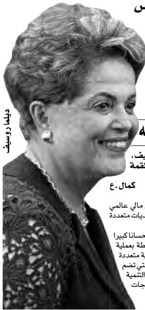
ديلا روسيف، رئيسة بنك التنمية الجديد.

وأضاف المتحدث تم استغلال هذه الفرصة لمناقشة طلب انضمام الجزائر إلى بنك التنمية الجديد، والذي لقي استحسانا كبيرا من طرف رئيسة المؤسسة وأفراد مجلس إدارته. كما صرح الوزير أنه تمت مناقشة الكيفيات العملية المرتبطة بعملية الانضمام، مشيرا إلى أن الجزائر "قد عبرت مؤخرا بصفة رسمية عن رغبتها في الانضمام إلى هذه المؤسسة المالية متعددة الأطراف". من جهة أخرى، ذكرت الوزارة بأن بنك التنمية الجديد قد أنشئ سنة 2015 من طرف مجموعة بريكس، التي تضم البرازيل وروسيا والهند والصين وجنوب إفريقيا برأس مال أولي يقدر بـ100 مليار دولار أمريكي، موضحا أن بنك التنمية الجديد الكائن مقره بشنغهاي بالصين، يهدف إلى المساهمة في النمو والتنمية العالميين وذلك من خلال تلبية احتياجات وتطلعات الدول النامية.