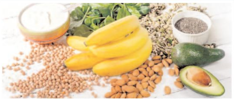
أفاد الخبراء أن اتباع نظام غذائي غني بالخضروات الورقية والمكسرات قد يكون أفضل طريقة لحماية أكثر أعضاء الجسم تعقيدا.