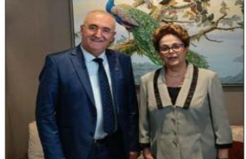
وخلال هذا اللقاء، تبادل الطرفان وجهات النظر حول «أشغال قمة باريس من أجل هيكل مالي عالمي جديد والدور المنظر من المؤسسات التي تواجهاها الدول النامية على وجه

وأوضح البيان أن «بنك التنمية الجديد الكائن مقره بشنغهاي (الصين)، يهدف إلى المساهمة في النمو والتنمية العالمين وذلك من خلال تلبية احتياجات وتطلعات الدول النامية».