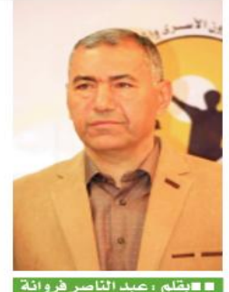
يقلم: سعيد الناصر فروانة