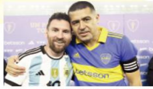
كشفت الاسطورة الأرجنتينية ليونيل ميسي، لاعب فريق إنتر ميامي الجديد، عن خفته للمرحلة المقبلة من مسيرته بعد انتقاله للنادي الأمريكي. وكان ميسي انتقل مؤخراً إلى إنتر ميامي بعد انتهاء عقده مع باريس سان جيرمان الفرنسي، الذي قضى بين صفوفه موسمين منذ انتقاله إليه في صيف 2021.

وخلال حضوره مباراة اعتزال مواطنه خوان ريكيلمي، نجم منتخب الأرجنتين السابق، والتي أقيمت في ملعب "لا بومبونيرا" التاريخي مقر فريق بوكا جونيورز، تحدث ميسي عن خفته للمرحلة المقبلة، وماذا سيفعل بعد انتقاله لفريقه الجديد. وقال ميسي في تصريحات لقناة "تي في بي" الأرجنتينية، "سأذهب في إجازة مع عائلتي خلال الفترة المقبلة، بعدها سأبدأ مشواري مع فريقتي الجديد". وأضاف أفضل لاعب في العالم لعام 2022، "أنا متحمس لبداية تلك التجربة، وسعيد بها للغاية. وأشوق للانطلاق في أقرب وقت". وكانت تقارير كشفت مؤخراً أن ميسي طلب من ليونيل سكالوني مدرب منتخب بلاده عدم