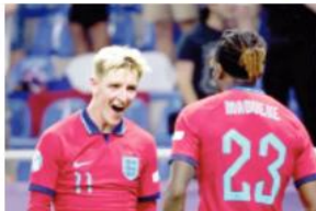
..إيطاليا تحيي آمالها في التأهل