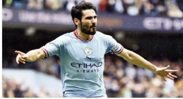
وشارك غوندوغان في 304 مباريات مع السيتي وسجل خلالها 60 هدفاً وصنع 40. منذ قدومه من برسييا دورتموند الألماني في 2016.

أعلن نادي برشلونة الإسباني، الإثنين، في بيان رسمي له، عن تعاقده مع الدولي الألماني، إلكاي غوندوغان في صفقة انتقال حر بعد نهاية عقده مع نادي مانشستر سيتي الإنجليزي، ليكون بذلك أولى صفقات النادي الكتالوني هذا الصيف. وقال برشلونة في بيان عبر موقعه الرسمي، "توصل نادي برشلونة وإلكاي غوندوغان إلى اتفاق بشأن ضم لاعب مانشستر سيتي لنادينا بمقدد مدة موسمين حتى 30 جوان 2025". وأوضح النادي الكتالوني في بيانه أن عقد غوندوغان تضمن شرطاً جزائياً قدره 400 مليون يورو، كما أنه يملك خيار التمديد لمدة موسمين إضافيين. ولم يكشف برشلونة عن رقم قميص غوندوغان، حيث أشار بطل الدوري الإسباني أنه سيغلق لاحقاً تفاصيل تقديمه للجمهور ووسائل الإعلام، ومن ضمنها رقم اللاعب مع النادي الكتالوني.