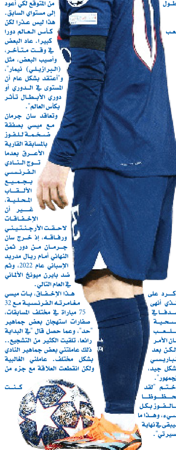
وكرد على الذي انتهى هدفاً في ضحية ملعب كان الأمر ولكن بعد بشكل جيد، الجمهور "وختم لقد محظوظا بالفوز بكل شيء، وهذا ما سببني في نهاية مسيرتي".

تعددت التجمعات التي يولي ميسي المنتقل حديثاً إلى انتر ميامي الأمريكي عن الصعوبات التي واجهها خلال الموسم الماضي في صفوف باريس سان جيرمان الفرنسي، وعن شعوره بخيبة أمل كبيرة جراء عدم الفوز بدوري أبطال أوروبا. وتطرق ميسي المتوج بمونديال قطر 2022 والذي احتفل بعيد ميلاده الـ 36 السبت الماضي -في مقابلة بثتها قناة "بي إن سبورتس"- إلى مغامرته مع نادي العاصمة الباريسي الذي انضم إليه في صيف عام 2021 بعد رحيله المفاجئ عن برشلونة الإسباني حيث أمضى 17 موسماً. وقال ميسي "جئت إلى باريس لأنني أحببت النادي، كان لدي أصدقاء في الفريق.. بدأ من الأسهل علي التكيف بخلاف أي مكان آخر كان من الممكن أن أذهب إليه". وأضاف: "في الواقع كان التكيف صعباً للغاية أكثر بكثير مما كنت أتوقع" بسبب "طريقة جديدة للعب وزملاء جدد ومدينة جديدة". وأردف الفائز بالكرة الذهبية لأفضل لاعب في العالم 7 مرات، "وصلت متأخراً، لم أشارك في فترة الاستعدادات التي تسبق الموسم"، كما أن "البدايات كانت صعبة علي وعلى عائلتي". في موسمه الأول، سجل ميسي هدفاً فقط في 34 مباراة، أصيب بشيرون كوروناً خلال وجوده في الأجنحة أثناء العطلة الشتوية، مما أجبره التوقف "شكل تام تقريبا لمدة شهر". ونجح ميسي في الارتقاء في بداية الموسم الثاني بالتويج المنتظر في قطر مع سان جيرمان في 2023. وقال ياسر المسجل رئيس الاتحاد السعودي، يسرنا أنه تم اختيار جدة، بمرافقتها الحديثة وشهرتها بتنظيم أحداث رياضية، لتكون المدينة المضيئة لكأس العالم للأندية، تمثل الرياضة