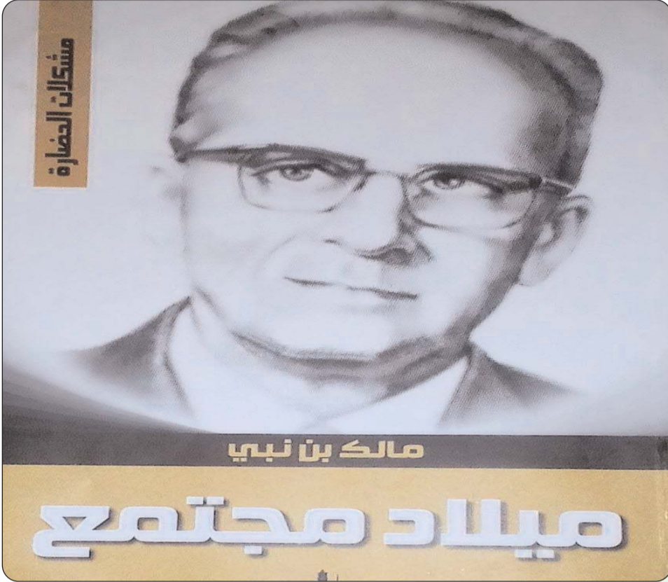
مالك بن نبي

ترصد "أخبار اليوم" مقالات في مختلف المجالات، وتُنشرها تكميلاً لأصحابها، ويهدف متابعي النقاد لها وقراءتها بأدواتهم، ولاطلاع القراء الكرام على ما تجود به العقول من فكر ذي متعة ومنفعة... وما يُنشر على مسؤوليئة الأساتذة والنقاد والكتاب وضيوف أي حوار واستكتاب وذوي المقالات والإبداعات الأدبية من حيث الملكية والرأي.