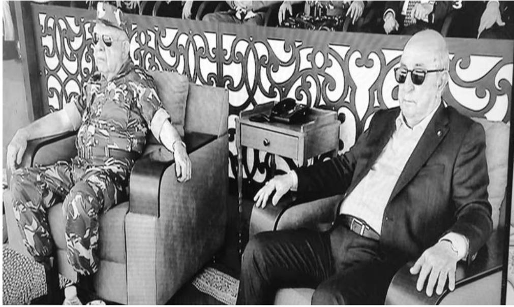
والمناورات بولاية الجلفة، الفريق أول السعيد شنقرية، حيث أدت له رئيس أركان الجيش الوطني

وأوضح المصدر، "صورة الجمارك الجزائرية والتي تحمل عنوان -على كل الجهات- تحاكي تجند أعوان الجمارك الجزائرية لتأدية مهامهم عبر كامل ربوع الوطن بكل شجاعة، التزام وإخلاص في سبيل حماية وترقية الاقتصاد الوطني والتصدي