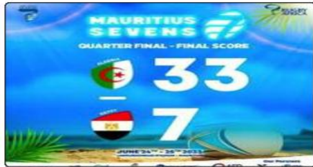
على المنتخب الموريسي (البلد المنظم) أشوان فوزا ثانيا على بوتسوانا (07-29) بنتيجة (5-14)، ليحقق بعدها زملاء جمال قبل أن يختم السباغي الجزائري الدور

الأول يفوز ساحق على ليزوتو بواقع (48-00). وهو ما سمح له بتصدر المجموعة الثانية برصيد 9 نقطة. ويشارك في هذه الدورة المخصصة للكرة الإفريقية 12 بلدا موزعين على ثلاث مجموعات. ويتعلق الأمر بالجزائر، بوتسوانا، بوروندي، الكاميرون، كوت ديفوار، مصر، غانا، جزر موريس، لوزونو، نيجيريا، الكونغو الديمقراطية والسنگال. تتأهل الفرق الأربعة الأولى إلى المرحلة النهائية للألعاب الأولمبية باريس-2024. إذا لم تتمكن جنوب إفريقيا مباشرة عبر سلسلة بطولات العالم للريغبي، فإن العدد يقلص إلى ثلاثة بلدان إفريقية.