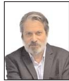
■ بقلم: صبحي حديدي

ولأنّ هذه هي فلسطين + الجولان السوري المحتل، وليست أفريقيا؛ فإنّ قلة قليلة من الإسرائيليين تحيي الذكرى الـ120 للمؤتمر الصهيوني السادس، الذي عُقد في بازل السويسرية سنة 1903، وخلاله أثار تيودور هرتزل ضجة عارمة حين اقترح إقامة «فلسطين يهودية» في أوغندا، آنذاك، التي هي بعض كينيا اليوم!