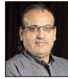
■ بقلم: أمجد عرار

غورباتشوف نفسه قال في ذلك الوقت إنه لكي نبني البناء الجديد علينا أن نكنس ركام البناء المنهار، والكنس هنا لا يحمل المعنى الحرفي للكلمة، بل أعمق من ذلك. حين رفع كثيرون شعار التغيير على جبهة ما سمي «الربيع العربي»، ظن البعض أن الدول التي احترقت شوارعها ومؤسساتها المدنية قبل العسكرية، وقتل أبناؤها وبناتها،