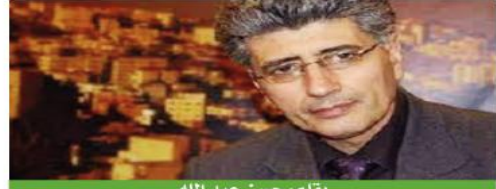
يقلم: حسن عبد الله

سنوات في متحف محمود درويش، حيث أشرت إلى أن إضراب نفحة موضوع الكتاب هو فعل جماعي بشراكة وطنية كاملة، فالجماعية هي التي صاغت الموقف وضمت في ترجمته حتى النهاية، وهنا تكمن أهمية التجربة، لأن الحركة الأسيرة في تلك الفترة استمدت قوتها من جماعيتها ومن شراكة فضائلها ومن توفيق قيادة كنفوه، وما كان للفرد أن يتصرف بمنأى عن الجماعة، لأن البطولة في التجربة للجماعة، ليصبح تلقائياً كل من انضوى في إطار الجماعة وتحرك بوحياها بطلاً يجد ذاته، ضمن جدلية العلاقة بين الفرد والجماعة، لفت انتباهي كباحث وأنا أبحث في التجربة الثقافية والإبداعية للمعتقلين الفلسطينيين أن الراحل الثقافية بين عناوينها العامة والفرعية ترتبط بإضرابات جماعية كبيرة وشاملة، وفيها يلي أسوق على سبيل المثال لا الحصر بعض الأمثلة، في إضراب عسقلان 1970 تم تحقيق مطلب الفدتر والقلم، وفي إضراب نفحة 1980 أصبحت الصحف الفلسطينية والعبرية اليومية متاحة للمعتقلين