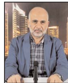
بقلم: مصطفى يوسف اللداوي

في هذا الإطار تأتي زيارة وزير الخارجية الأمريكي إلى الصين، في إطار نداء سياسي لمحاولة فك شيفرة ملفات عالقة، ثقيلة الحجم، لأول مرة منذ 5 سنوات.. منعرج يأتي بعد الانسحاب الأمريكي المتكرر من الاتفاقيات الدولية، وفرض عقوبات على موظفي المنظمات الدولية، وشن حروب تجارية، والقمع الوحشي لشركات التكنولوجيا الفائقة الأجنبية،