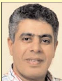
بقلم: عماد الدين حسين

تعهد المؤتمر رفيع المستوى لدعم الاستجابة الإنسانية في السودان في جنيف الاثنين الماضي بمشاركة مصرية وخليجية وأوروبية وأمريكية وأفريقية، حيث تم إقرار دفع 1,5 مليار دولار للسودان.