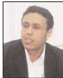
بقلم: لطفي العبيدي

بمقابل إغداق العطاءات وسخاء التقديرات للكيان الصهيوني، فإن الإدارة الأمريكية تلقي بالفتات من المساعدات للفلسطينيين، وتقوم بتوزيعها على بعض المؤسسات الصحية والتعليمية المحدودة، وتقرض عليها شروطها وتقوم بمراقبتها ومتابعتها، وأحياناً بحسابتها ومعاقبتها، وتكتفي بتقديم الدعم اللافت للأجهزة الأمنية الفلسطينية التي تقوم بتقديم خدمات مباشرة للاحتلال الإسرائيلي من خلال عمليات التنسيق الأمني المشتركة التي يشرف عليها ضباط أمريكيون كبار، ويصرون على الاستمرار بها