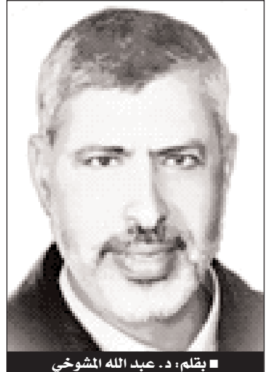
■ بقلم: د. عبد الله المشوخي

وبالمقابل تتحمل الزوجة مسؤولية البيت ورعاية الأبناء وحسن تربيتهم لا سيما في مرحلة الطفولة والإشراف عليهم . فهي مسؤولية مشتركة متكاملة. فالكل راع وكل راع مسؤول عن رعيته. ولكي يتحقق نجاح هذا الزواج أرشدنا الرسول صلى الله عليه وسلم إلى تزويج الكفء صاحب الخلق والدين ممن توفرت فيه الأخلاق الحميدة والخوف من الله إضافة إلى قدرته على النفقة وتحمل المسؤولية فهو جدير بالزواج.