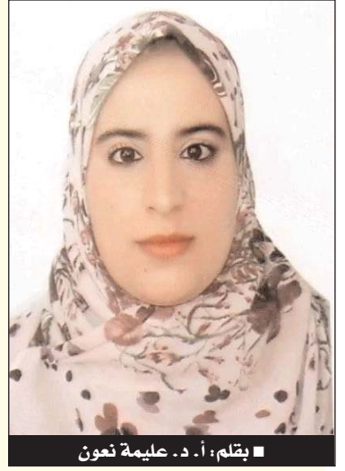
■ بقلم: د. عليمة نون