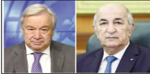
لصلاح العطارن الدولي والمحل السلمي إنني أحيي تسبلك الجزائر المستمر مبداهن وقيم ميشاق الأمم المتحدة، وكذلك

أعرب الأمين العام للأمم المتحدة، السيد أنطونيو غوتيريش، في رسالة وجهها إلى رئيس الجمهورية السيد عبد المجيد تبون، عن تهنئته الحارة بمناسبة انتخاب الجزائر بمجلس الأمن للفترة 2024-2025، حسب ما أفاد به يوم الخميس، بيان لرئاسة الجمهورية.