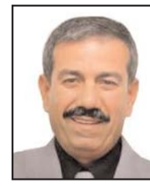
بقلم: حمادة فراغنة

في مواجهة قدرات تفوق المستعمرة، لم ينتظر الفلسطينيون أكثر من يوم واحد للرد على مجزرة مخيم جنين، والنيل من مجموعة من المستوطنين المستعمرين الأجانب في استراحة محطة محروقات على طريق نابلس رام الله، ووجهوا لهم ضربة موجعة سريعة، دفعت كل مؤسسات المستعمرة وقياداتها للهرولة من أجل متابعة الحدث.