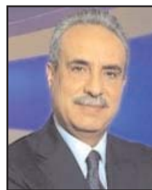
بقلم: محمد كrichان

زلامبيدوزا" تلك الجزيرة الواقعة في أقصى جنوب إيطاليا، بين مالطة وتونس والتي لا يتجاوز عدد سكانها بضعة آلاف وكانت في الماضي مجرد سجن أو منفى، كثيراً ما يتردد اسمها عند الحديث عن موجات الهجرة غير النظامية من تونس وليبيا فهي الأقرب إلى شواطئها، وإليها ينشد الوصول مئات القوارب خاصة مع تحسن أحوال الطقس خلال الصيف. لامبيدوزا هذه كان توجه إليها بطريقة غير نظامية آلاف التونسيين بعد ثورتهم عام 2011 وصاروا يهتفون عند الوصول إليها «لامبيدوزا حرة حرة والطيان على برّه» هي من اختارها الطبيب والروائي التونسي علي المراداسي عنواناً لروايته الجديدة الصادرة مؤخراً والتي صادفتها وصاحبها في معرض الدوحة للكتاب هذه الأيام. الرواية المستوحاة من أحداث واقعية،