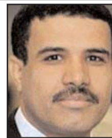
بقلم: محمد جميع

شاهد الصحافي اليهودي النمساوي ليوبولد فايس في القدس مجموعة من المسلمين يقومون بحركات يقرأون أثنائها بعضاً من القرآن، وعرف أن تلك هي صلاة المسلمين، وحاول الاستفسار عن دور الجسد في الصلاة التي يفترض أن تكون عملاً قلبياً خالصاً، فسأل الإمام عن ذلك، وجاء الرد الذي سجله في كتابه «الطريق إلى مكة» في قوله: «بأي وسيلة أخرى تعتقد أننا يمكن أن نعبد الله؟ ألم يخلق الروح والجسد معاً؟ وبما أنه خلقنا جسداً وروحاً ألا يجب أن نصلي بالجسد والروح؟» في إشارة إلى ضرورة فهم الشعائر الحسية في الإسلام مرتبطة بمحتوياتها الروحية.