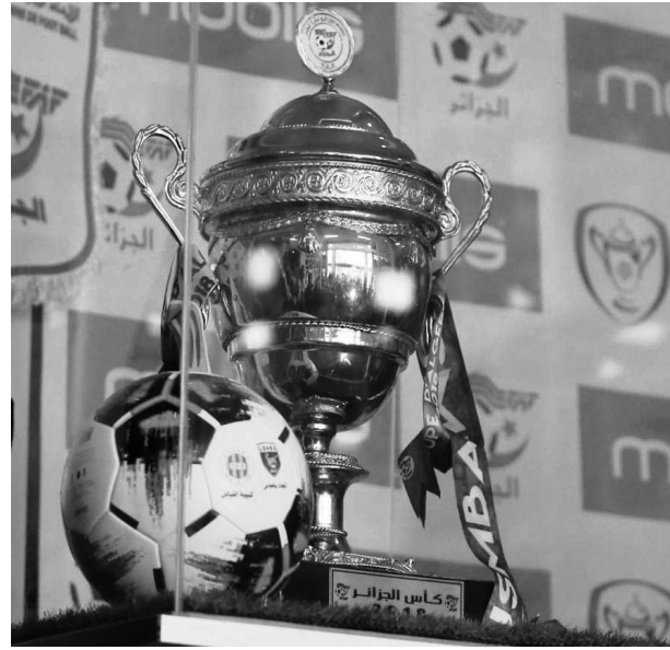
منافسة البطولة المحترفة، حيث يتقدم بثبات حول لقبه

ويسعى "البلوزداديون" لمعانقة الكأس التاسعة ومن ثمة الانفراد بالرقم القياسي الوطني في التتويج، وفي المقابل يتطلع "الشفاوة" لرفع الكأس الثانية في تاريخهم بعد تتويجهم الأول في 2005 أمام اتحاد سطيف بهدف دون رد بعد الوقت الإضافي. ووصل البلوزداديون إلى النهائي للمرة الحادية عشرة في تاريخهم، فيما يخوض أسود الونشريس النهائي الثالث. وسيكون شباب بلوزداد على الورق مرشحا بامتياز للفوز، إذا أخذ بعين الاعتبار مشواره في