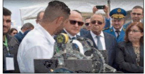
كما دعا السيد عون متربصي وخريجي القطاع، خلال مشاركته وفقا لأعضاء من الحكومة، بدعوة من وزير التكوين و التعليم المهنيين، في مراسم الفتح الطعة الثالثة من الصالون الوطني للابتكار، إلى التقدم إلى السلطات المحلية المكلفة بدعم

الاستثمار لا سيما عبر فروع الوكالة الخيرية لتطوير الاستثمار ل«لاستفادة من جميع المزايا التي يمنحها قانون الاستثمار الجديد للشباب و حاملي المشاريع، لتعزيز نسج المؤسسات الصغيرة والمتوسطة الصناعية الذي يعد دعامة لتحقيق التنمية والازدهار الاقتصادي للبلاد» و خلال مراسم الفتح هذه الطعة المنظمة تحت شعار «مستثمرون في دعم الابتكار»، والتي جرت بديوان حضرات الرياضات و التسلية «مترو الصابلات» بالجزائر العاصمة، زار الوفد الوزاري مختلف أجنحة هذا المعرض الذي يعرف مشاركة أكثر من 90 مشروعا مبتكرا في شتى المجالات من إنجاز خريجي قطاع التكوين والتعليم المهنيين، وفقا للبيان.