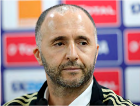
الذي كان استثنائيا وجعلنا نعيش لحظات رائعة " أمين ب.

كشف النّاحب الوطني جمال بلماضي خلال تصريحات أدلى بها عقب المباراة الودية التي جمعت بين منتخبنا الوطني أمام المنتخب التونسي و التي انتهت بالتعادل بين المنتخبين عن إمكانية ضم أسماء جديدة في قائمة الخضر خلال الترتيب القادم و أضاف مصرّحا : " هناك إمكانية وجود وجوه جديدة في الترتيب المقبل ، يجب التعلّق بخصوص التشكيلة و لا يمكنني تغييرها بشكل كبير ، ارتكبنا اليوم بعض الأخطاء أمام منتخب قوي تكتيكيا و بدنيا و نحن اخترنا تونس لهذا الغرض ، كنا قادرين على الفوز و فرضنا منطلقنا خلال الشوط الثاني ، عوّار لاعب جيّد و سيكون عنصرا مهماً في أقرب الأجل " و في سياق متصل اعتذر المدرب الوطني جمال بلماضي عن المشادات التي وقعت بينه و بين لاعب المنتخب التونسي قائلا : " الداربيات المغاربية دائما ما تكون هكذا و أعتذر عن الشجار الذي وقع بيني و بين اللاعب التونسي كما أشكر الجمهور العنابي