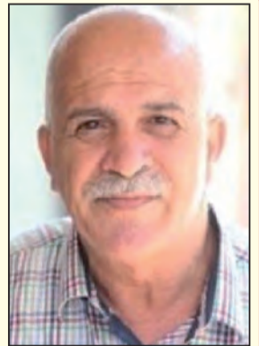
بقلم :- راسم عبيدات