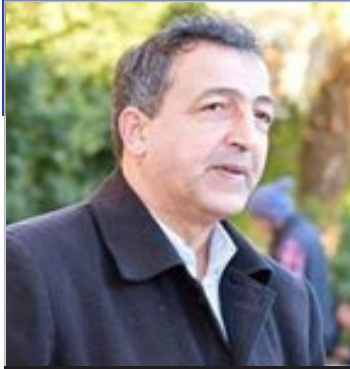
بقلم / معمر حيار

والتوزيع، 1982، من 350 صفحة. [6] "غزو الجزائر" ل: أم. بيرو، ترجمة: الأستاذة: ليلي بن عرار، دار التنوير، الجزائر، الطبعة الأولى، 2014 من 157 صفحة. [7] للزيادة راجع من فضلك مقالنا بعنوان: غزو الجزائر - معمر حيار [8] "الزهرة النائرة فيما جرى في الجزائر حين أغارت عليها جنود الكفرة"، تحقيق خير الدين سعدي الجزائري، دار أوراق ثقافية، جبيل، الجزائر، السداسي الأول 2017، من 174 صفحة.