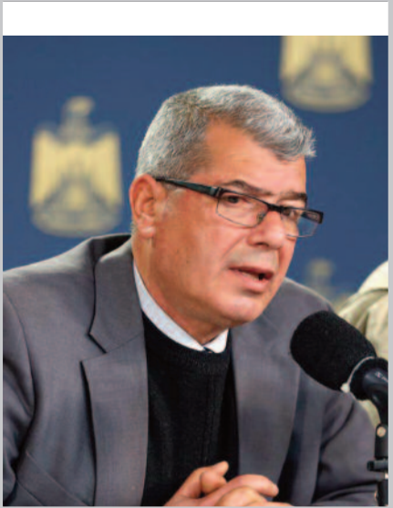
بقلم: عيسى قراقع

يبتسم الفناء داخلي، لأنكم رفعتم رأسكم مرة