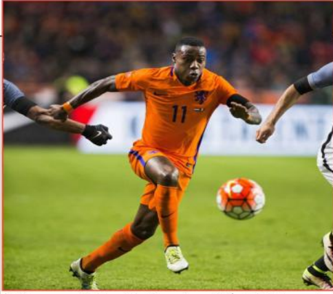
لواء مصابات المخدرات، حيث استثمر ملاين اليوروهات في هذه التجارة المخرمة دوليا. وخاض بروميس في موسم 2022-23 37 مباراة بقميص سبارتاك موسكو سجل خلالها 25 هدفا في جميع المسابقات، وقدم 10 تمريرات حاسمة.

في السجن أم لا. ويواجه كوينسي بروميس اتهامات أيضا من جانب النيابة الهولندية، بجلب أكثر من 1300 كيلوغرام من الكوكايين، حيث حاول إدخال مجموعة من المخدرات تصل قيمتها إلى 75 مليون يورو في 25 أبريل الماضي. وسبق أن نفذ المحترف السابق في أندية أياكس وتيفنتي الهولنديين وإشبيلية الإسباني وأخيرا سبارتاك موسكو الروسي، عقوبة السجن قبل ثلاث سنوات، أي في عام 2020 بتهمة الطعن والانتماء إلى إحدى مصابات ترويج المخدرات المنظمة، وذلك قبل الإفراج عنه. وفي وقت سابق، كتبت صحيفة "دي تلغراف" الهولندية عن تورط المهاجم الدولي الذي كان أحد المنتخبين إلى قائمة منتخب هولندا في يورو 2020، في الانخراط تحت