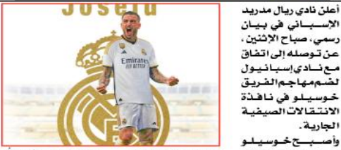
أعلن نادي ريال مدريد الإسباني في بيان رسمي، صباح الإثنين، عن توصله إلى اتفاق مع نادي إسبانيول لضم مهاجم الفريق خوسيلو في نافذة الانتقالات الصيفية الجارية. وأصبح خوسيلو رابع صفقات النادي الملكي، في انتقالات صيف 2022، حيث ضم المرينغي جود بيلينغهام من بوروسيا دورتموند، كما أعاد إيفران غارسيا إلى صفوفه مرة أخرى بعدما أصر الأول إلى ميلان وانتقل الثاني لريال مدريد في عام 2011. وقال ريال مدريد في بيانه: "لقد اتفق نادي ريال مدريد وإسبانيول موسم 2022-23، إذ تمكن