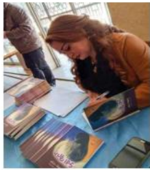
هزني تخيل العشق أفرغ سلال الحزن مني اعاد تكون قلبي كما الجنين الكون أنت بعثرت كل القوائين

امتزج صباحي بعطر انفاسك كحلت ناظريا بجميالك ثرت الامل سكرك اسطري صراع بين الكلمات يبخل علي بنسج القصيدة اسكن قلاع المشاعر زورق من نور يجرني اوردة العشق نصل قصيدتي بك وشم في جدار الروح خوابي رحيق الامنيات ترشح خمر الاغنيات موسيقا ازلية... ايدية