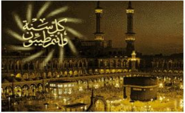
كل سنة كل سنة طاب طيب

يجب أن يتذكر المسلمون في عيد الأضحي المبارك الوقت الذي يمكن أن يرضى عن انتهاكها الكبير لتبنيهم صلى الله عليه وسلم في حجة الوداع ويستحضر تلك الكلمات النبيرة التي القاها الهادي البشير رسول الله صلى الله عليه وسلم في الأصداد الغفيرة والحشود الكبيرة من المسلمين في هذا اليوم العظيم عند ما شرح وبين لهم الدستور الإلهي لأمة المسلمة با لخصوص على امتداد الزمان في حياته وبعد مماته إلى أن يرت الله الأرض ومن عليها، ويتقنون من هذه الخطبة الجامعة بعض المسائل الخالدة التي بدأها النبي الكريم صلى الله عليه وسلم مؤكداً أن الإسلام يحرس على تأمين الحقوق وحماية أمور الناس في التضام