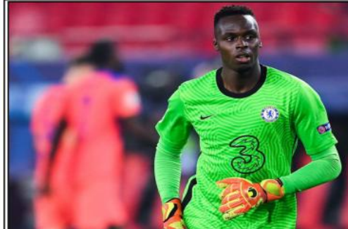
أكدت تقارير صحفية أن نادي أهلي جدة السعودي قد توصل إلى اتفاق مع الدولي السنغالي، إدوارد ميندي، حارس مرمى تشيلسي، لينضم إلى النادي العائد لدوري روشن السعودي اعتبارا من الموسم الجديد 2023-24. ودخل الأهلي في مفاوضات مع ميندي قبل عدة أيام، في ظل رغبة الراقي بتعزيز صفوفه بلاعبين من طراز عالمي للمنافسة على الألقاب مرة أخرى، واستعادة اللقب الخائب عن خزائنه منذ 08 سنوات حيث يعود آخر تتويج له لوسم