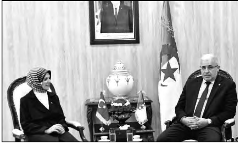
ونميمة. من جانبها عبرت السفارة التركية عن امتنانها التضامنية الواسعة مع تركيا إثر الزلزال المدمر لنواب المجلس الشعبي الوطني نظير هتبهتم

الذي ألم بها واعتبرت ذلك واجبا تمليه العلاقات التاريخية والروابط العميقة بين الدولتين والشعبين الشقيقين. وأكدت غوكتاش أن تركيا تسعى إلى تعزيز استثماراتها بالجزائر، موضحة أنها تستهدف الانتقال بالمبادلات التجارية بين البلدين من 5 مليارات دولار إلى سقف 10 مليارات دولار، ودعت، في هذا الخصوص، إلى العمل من أجل إبرام اتفاقية للتبادل الحر تفضي إلى شراكة مربحة للطرفين. وعلى الصعيد البرلماني، أبرزت السفيرة ضرورة تفعيل دور مجموعات الأخوة والصدقة البرلمانية في تعزيز الشراكة بين البلدين الصديقين لاسيما على ضوء مخزجات زيارة الدولة التي أداها عبد المجيد تبون، رئيس الجمهورية، إلى تركيا والتي تكللت بتوقيع اتفاقيات في عديد المجالات.