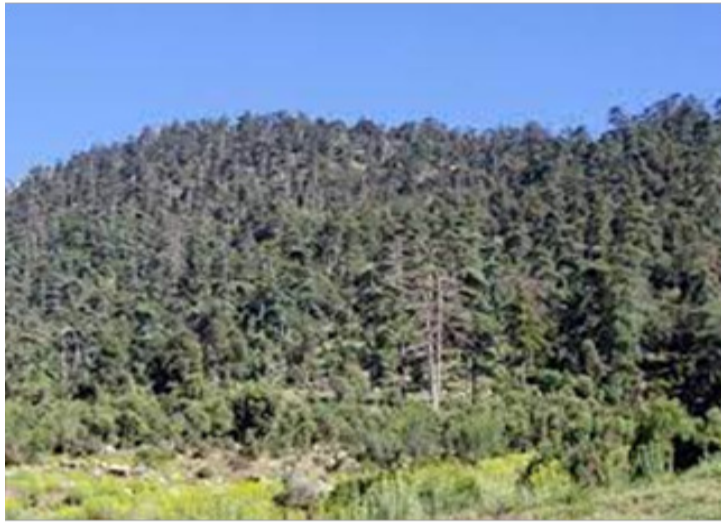
في حالة تأهب قصوى، لتجنب أو مواجهة أي طارئ وذلك طيلة أيام الأسبوع على مدار 24/24 ساعة، إضافة إلى "تكثيف

الدوريات المشتركة على مستوى كل الفضاءات الغابية، وبمحاذاتها من طرف مصالح الغابات والحماية المدنية والأجهزة الأمنية". وللحد من مخاطر اندلاع الحرائق الغابية، كشفت الوزارة في ذات البيان عن "تجميد إنتاج مادة الفحم". أما على المستوى الوقائي، تتضمن هذه الإجراءات، تعزيز الحملات التحسيسية عبر كافة وسائل الإعلام المكتوبة والمسموعة، والمرئية إضافة إلى شبكات التواصل الاجتماعي والإذاعات المحلية، يضيف المصدر نفسه. وفي هذا السياق، دعت الوزارة كافة المواطنين ولجان المحلية لسكان المجاورين للغابات، لضرورة التقيد بكافة الإجراءات الوقائية لمواجهة أي طارئ"، مذكرة بالرقم الأخضر 10-70 للتبليغ عن كل خطر أو تجاوزات تمس سلامة الغابات أو تهدد باندلاع نيران. وتدرج هذه التدابير حسب البيان، في إطار "السهر على المحافظة على الثروة الغابية وعلى سلامة الأشخاص والممتلكات الكائنة بمحاذاة الوسط الغابي، والتي تلزم كافة المتدخلين، بالتجند التام والمتواصل طيلة فترة الحملة".