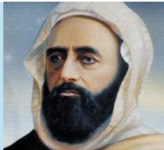
تحتضن الجزائر خلال الفترة ما بين 17 و25 جوان الجاري، الطبعة الأولى من

ملتقى الجزائر للإبداع الأدبي والفني، من تنظيم الاتحادية الجزائرية للثقافة والفنون ورعاية وزارة الثقافة والفنون. ويشارك في هذه التظاهرة الثقافية في طبعتها الأولى التي جاءت تحت شعار "لنا في كُـلِّ مَكْرَمَةٍ مجال"، مجموعة كبيرة من الشعراء والأدباء من عديد البلدان العربية. وسطرت الاتحادية الجزائرية للثقافة والفنون من خلال ملتقى الجزائر للإبداع الأدبي والفني برنامجاً متنوعاً بين الأدب والسياحة.