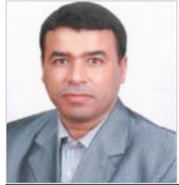
نصوص بقلم عبد القادر

قام الرجل فجأة وكأنه قد جن جنونه واحتضن جثة ابنه ، وظل يصرخ ، ويقول : — يا ابني ! يا حبيبي ... كانت يدها تعتصران ابنه ، وهو يضمه الى صدره ، ويلصق وجهه بوجه ابنه ،