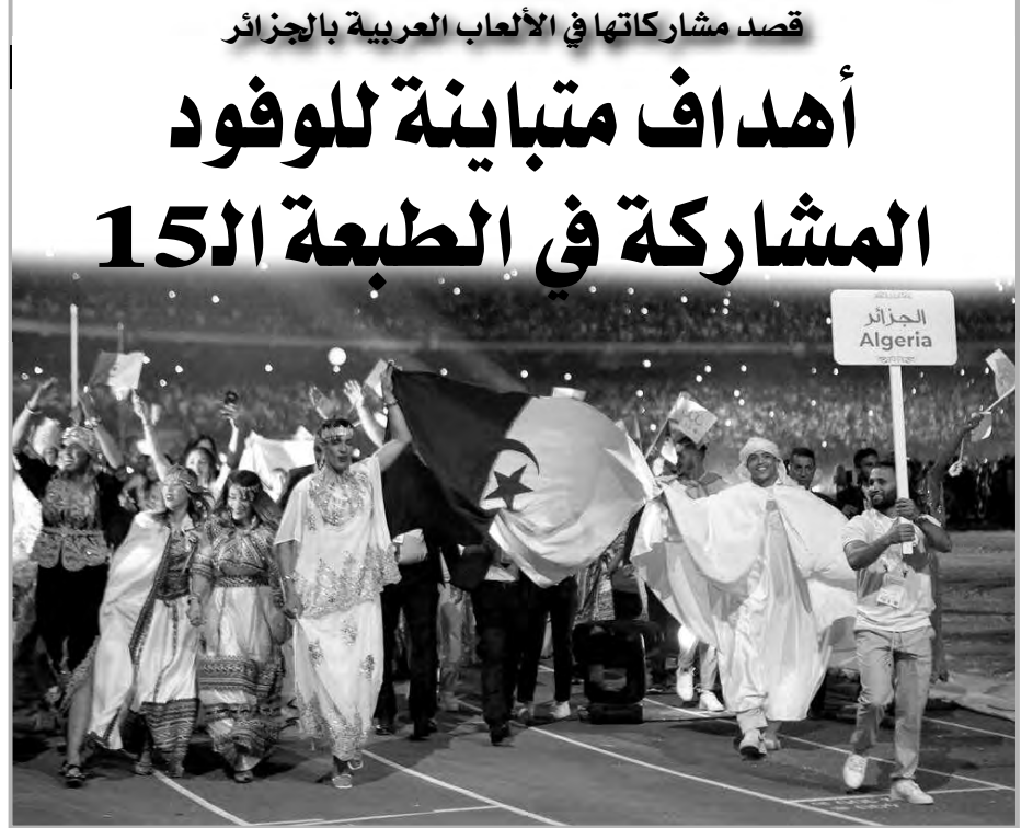
تتطلع الوفود المشاركة في النسخة 15 للألعاب العربية التي تتشرف الجزائر باحتضانها في الصائفة المقبلة، لكسب رهاناتها بامتياز بعد غياب التظاهرة عن الساحة التنافسية الإقليمية لمدة 12 سنة من جهة، واتخاذها كورقة حاسمة للتأهل لأكبر استحقاق رياضي عالمي، أولمبياد باريس 2024، بعد إدراجها ضمن الرزنامة الدولية لجل الاتصايات الدولية لاختلاف التخصصات، من جهة أخرى.

كانت مستعدة كما يجب لكسب التحدي الجديد الذي كان ينتظرها، لإضافة لقب جديد إلى خزينتها التي تعج بالألقاب والكؤوس، التي جلبتها على مدى السنوات 13 الماضية. وفي هذا الجانب، علق عن الدورة وتوزيع فريقه قائلاً: "ليس سهلاً أن تتفج بلقب جديد، وهو 14 على التوالي، لذا سعدنا كثيراً، وهذا يدل على كبر هذا النادي ولأعبائه الذين ينشطون فيه. وأشكر كل من ساهم في هذا التتويج سواء من قريب أو بعيد، ومن ساعد على بقاء نادي محمد يوضيف واقفاً صلباً، ومستعداً لكسب التحديات والألقاب". وأضاف: "هذه هي دورة اللقب، والحسم في هوية بطل هذا الموسم. ونحن دخلنا بنية الفوز باللقب لا غير، وبالتالي إثراء سجل فريقنا الحافل بالألقاب. وعوّلتنا على كامل لاعبينا؛ ذلك أن عيادة الفريق كانت فارغة من أي مصابين. والحمد لله على هذا النجاح الجديد".