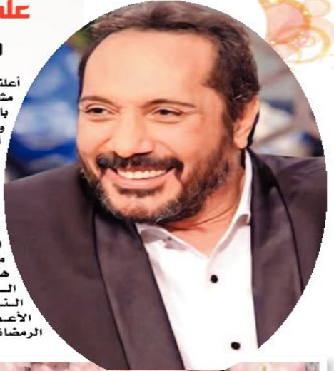
استفتاء مهرجان همسة الدورة الـ 11 تصويت النقاد لأفضل الأعمال الدراما الرمضانية.