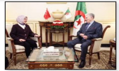
«استقبلت رئيس مجلس الأمة، صالح فوجيل، أمس، سفيرة تركيا لدى الجزائر، ماهينور أوزدمير، التي أدت له زيارة وداع إثر انتهاء مهامها بالجزائر بعد تعيينها وزيرة في الحكومة

التركية بعد انضمام رجب طيب أردوغان رئيسا للجمهورية التركية لهعدة ثالث، حسب ما أفاد بيان للدبلوماسية. وذكر فوجيل وفق بيان للفرقة العليا للبرلمان ب«العلاقات النوعية المتميزة والتاريخية التي تربط البلدين الشقيقين اللذان يبرهنهما اتفاق شراكة استراتيجية يجب تعميقها أكثر وهي العلاقات التي تعرف نقلة نوعية من حيث التنسيق والتعاون في مختلف المجالات فتناسيا والإرادة السياسية التي تحمؤ قاندي