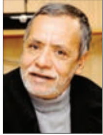
■ التهامي مجوري

في سنة 1929 تلقى الأستاذ محمد رشيد رضا، صاحب مجلة "المنار" رسالة من أحد تلاميذه في شكل أسئلة حول مشكلات العالم الإسلامي، مضادها لو أن الأستاذ شكيب أرسلان يكتب لنا عن سبب تأخر المسلمين، وكيف تفوق الغربيون عليهم، بحكم أن الأستاذ شكيب أرسلان واسع الاطلاع على التاريخ العربي والإسلامي، وملمٌ بحركة النهضة في الغرب وعارف بأسباب تفوقها، وبحكم وجوده في الغرب أيضا، فهو على احتكاك مباشر مع حركة الفكر والثقافة بشقيها الغربي والإسلامي.