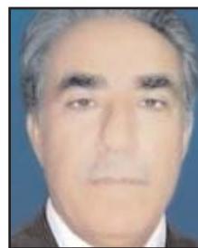
بـقلم: مـزهر جـبر السـاعدي

نوي تركي لتوليد الطاقة الكهربائية، وتركيا ليس بحاجة إلى طلب الإذن من أحد، وفعلا تم أو يجري العمل على بناء محطة نووية لتوليد الطاقة الكهربائية بمساعدة روسيا، بالإضافة إلى مصر وأيضا بمساعدة روسيا. إنه أمر طبيعي أن تسعى الدول إلى امتلاك محطات نووية لتوليد الطاقة الكهربائية، لكن طبيعة الأوضاع الدولية، سواء في المنطقة العربية أو جوارها، أو بقية مناطق العالم، في الوقت الحاضر أو في العالم المتعدد الأقطاب المستقبلي، سيكون هناك صراع تنافسي، اقتصاديا وسياسيا وتجاريا وعسكريا، والأخير لجهة حيازة عوامل القوة للحفاظ على المصالح وردع من يتجاوز عليها؛ في ظل التسارع على المسابقة على انضمام هذه الدولة لبرنامج هذه الدولة العظمى، أو إلى تلك الدولة العظمى.