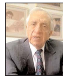
بـقلم: عـلي مـحمد فـخـرو

العالم تظل مثل هذه المؤسسات عند المسلمين، ومثلها الكنيسة عند الإخوة المسيحيين، ملاذا بالغ الأهمية للتخفيف من وباء الوحدة النفسية. فالنشاطات التبعية والاجتماعية المشتركة، واللقاءات المتعددة في اليوم بالنسبة للمسجد، لا يمكن إلا أن تقود إلى شعور الأفراد إلى نوع من الطمأنينة النفسية عندما يلتقون يوميا بمن يتفاعل معهم، ويهتم بأحوالهم، ويسأل عن أسباب غيابهم، ويزورهم في مرضهم، ويواسيهم أثناء محنتهم ووفاء أحد أقربائهم. لقد أدركت الديانات هذا الأمر منذ قديم الأزمنة وواجهته بوجود مؤسسات العبادة المشتركة، لكن الحكمة والرأفة الربانية كانت تنهيا لمواجهة هذا الانزلاق العولمي المؤلم الحالي نحو الوحدة النفسية في المجتمعات المحلية.