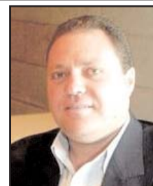
بـقلم: سـري القـدوة

والتوقف عن محاربة السلطة الفلسطينية وأهمية دعم عملها وتعزيز دورها الوطني والسياسي من خلال العودة للعملية السياسية وان لا يكون التحرك الدولي من أجل السلام الاقتصادي فقط كما يتم الترويج له من قبل حكومة الاحتلال .