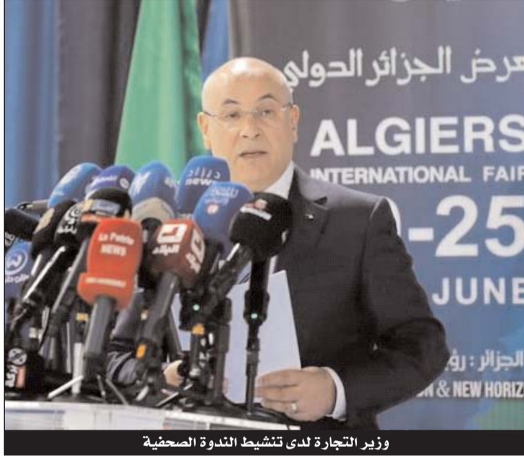
وزير التجارة لدى تنشيط الندوة الصحفية

ينتظر معرض الجزائر الدولي "فيا"، في طبعته 54، التي ستنظم بالجزائر العاصمة من 20 إلى 25 جوان الجاري، مشاركة 473 شركة جزائرية و165 أجنبية من 30 دولة، حسب ما أفاد به أمس الأحد وزير التجارة وترقية الصادرات، الطيب زيتوني الذي أعلن عن إطلاق أول صالون جزائري رقمي، بالمناسبة.