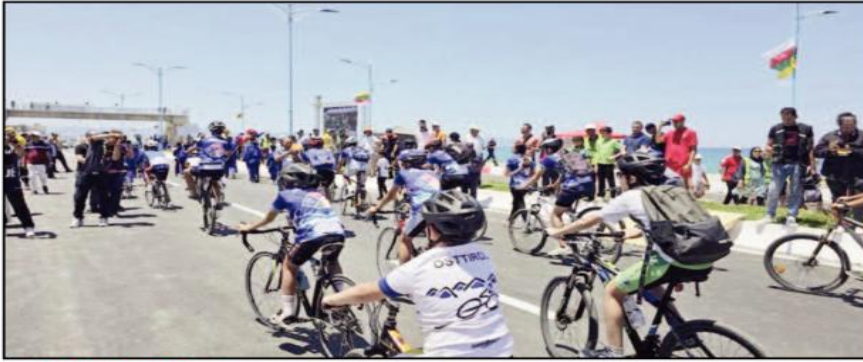
مجانبة الشواطئ لا نقاش فيها

وفيما يتعلق بـ«مجانبة الشواطئ» التي تعد من بين الأسباب التي تتغص على المصطافين والسياح يومياتهم بسبب أصحاب العصى الغليظة المنتشرين عبر الشواطئ لفرض منطقتهم، فقد شددت وزارة الداخلية من خلال تعليمات صارمة ومباشرة لمصالح الأمن والسلطات، على ضرورة فرض احترام مبدأ «مجانبة الدخول إلى الشواطئ»، والتصدي لكل مظاهر الاستغلال العشوائي لها، مع اتخاذ الإجراءات «الردعية اللازمة» في حق المخالفين.