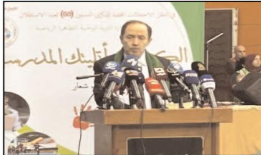
وأبرز الوزير، بأنه سيتم استغلال أسبوع المدرسة، الذي سينظم خلال الأسبوع الأخير من شهر جوان في التوعية والتحميس من مخاطر آفة المخدرات على أن يتواصل العمل في إطار في الحملة التحسيسية والتوعوية مع مطلع الموسم الدراسي المقبل، بتطبيق أبواب مفتوحة لفائدة التلاميذ والأطعم الإدارية والتربوية على مستوى المؤسسات التعليمية بالتعاون مع الأجهزة الأمنية وإشراك الأطباء والأخصائيين النفسيين، وإطلاق مسابقات وطنية لفائدة التلاميذ حول المخدرات وتعزيز ثقافة الوقاية منها لديهم».

إعداد دعائم تحسيسية وقائية ذات صلة بالموضوع. كما ستنظم طيلة السنة الدراسية 2023-2024 - حسب الوزير - عمليات في هذا الإطار منها مراقبة ومتابعة التلاميذ نفسيا وبيداغوجيا بالتنسيق مع وحدات الكشف المتشعبة في الشق الوقائي على مستوى لجان الإرشاد والمتابعة في المنوسطات، وخلافا للإصفاة والمتابعة النفسية والتربوية في الثانويات. وسيتتم، خلال السنة الدراسية المقبلة، إعداد رزمة على مستوى مديريات التربية لتنظيم أيام تكوينية للأطعم الإدارية والبيداغوجية حول كينيات اكتشاف حالات تعاطي المخدرات وطرق التعامل معها بالتنسيق مع قطاع الصحة.