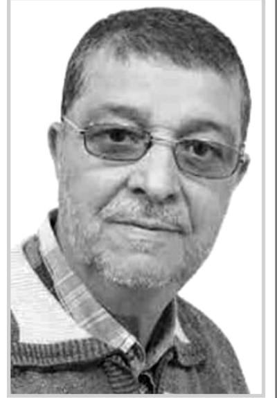
بقلم قرار المسعود

أجدادي دفاعا عنه. إن ما تُلخ عليه الجزائر في كل المناسبات نابع من اليقين والقناعة التي تستظل متجذرة في وجدانها، لتذكي في نفوسنا النخوة وتقوي اللحمة الوطنية والثبات على العمل الجماعي في سبيل الوطن. فالطالب المتعلِّق باستعادة الأرشيف والممتلكات ورفات المقاومين والتجارب النووية والمفقودين هي الصورة التي تبين طهارة تاريخنا المجيد المبني على الشريعة السمحة وهو الدرس الذي جاء على لسان الرئيس بمناسبة الذكرى الثامنة والسبعين (78) والذي ينبغي أن تحفظه الأجيال " إن الدولة وفاء للتضحيات الجسيمة للشعب الجزائري، عازمة في الجزائر جديدة على وضع ملف التاريخ والذاكرة في المسار الذي تتمكن فيه من إضفاء كامل الشفافية والنزاهة والموضوعية، بعيداً عن أية مساومات أو تنازلات". ولكن هذا الدرس لم يستوعبه المستعمر الغاشم بعد 130 سنة وما زال لحد الآن لم يفهم بعد معنى ومقدار القدسية و