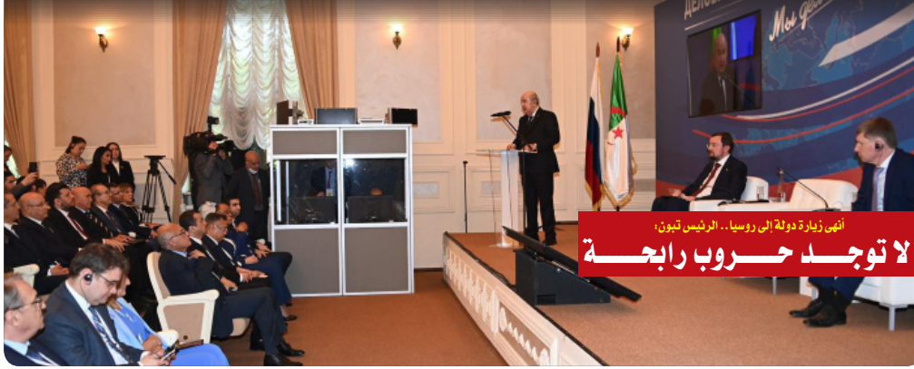
أنهى زيارة دولة إلى روسيا.. الرئيس تبون، لا توجد حروب رابحة