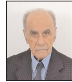
بقلم: محمد عاكف جمال

ووفقاً لدراسة أجراها معهد البحر الأبيض المتوسط للدراسات الإقليمية «معهد ميديترانيان» في أغسطس 2021، وهو مؤسسة أكاديمية غير حكومية، فقد العراق الجزء الأكبر من موارده المائية خلال فترة زمنية وجيزة، فعلى سبيل المثال بلغ حجم المياه التي دخلت العراق في عام 1933 عبر نهر الفرات من تركيا