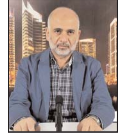
بقلم: مصطفى يوسف اللداوي

أي أن الحديث عن الهدنة يأتي هذه المرة في ظل أجواء هادئة على الجبهة الجنوبية في قطاع غزة، بما يشير إلى أن هناك من يفكر ويخطط للاستفادة من فترة الهدوء السائدة في فرض اتفاق «أمي-اقتصادي» بين الجانبين، يطمئن العدو الإسرائيلي من خلاله على أمنه من الناحية الجنوبية،