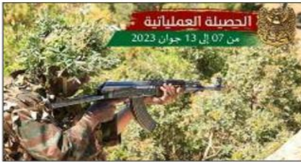
الحصيلة العملياتية من 07 إلى 13 جوان 2023