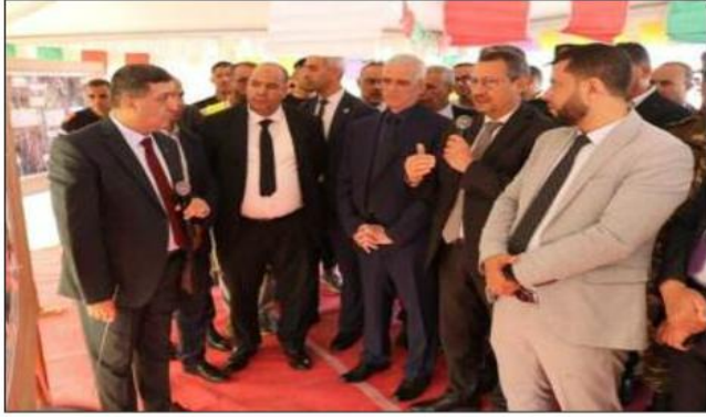
نوفمبر القبل، حسب التزامات مؤسسة الإنجاز. أما في بلدية اشغال تعزيز شطر طوله 21 كلم من الطريق الوطني رقم 40 بوغزول (جنوب المدينة) فقد اعطى الوزير إشارة انطلاق الذي يربط بين بوغزول والشهوية

أكد وزير الأشغال العمومية والتمثلات القاعدية، لخضر رخوخ يوم الثلاثاء بالمدينة على التكفل بكامل الصعوبات المتسببة في التأخر المسجل في إنجاز أشطر الطرق الخاصة بمشروع الطريق الإجتابي الرابع للجزائر العاصمة الذي سيربط عديد بلديات وولاية المدينة.