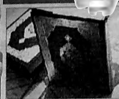
بريم للمواريين من أنصاري إلى الله فال المواريون نحن أنصار الله فابسة طالفة من بني اسرائيل وهكبرت طالفة فابندا الذين آمنوا على صومهم فاصبحوا ظاهرين.

وأخري نصونها نصر من الله وفتح قريب وبشر المؤمنين ، اوند برونو سولافا بونشنتي سالكزياة ثوط ذغنا اشعلمتس ذ نصر ارب غف اعداوا اتون اسيس التوعزم واتفرحم، ذ كتشوم غرمكة سلقرب، (ذ الفتح اوسعان سرفم ارزق اطلقتن ابن افوكلال وين يزفان اقوبريد ارب اسونم اقلهان) بشر المؤمنين. بأيها الذين آمنوا هونوا أنصار لله فيما قال عيسى ابن