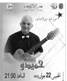
الخميس 22 جوان 2023 لغة: 21:00