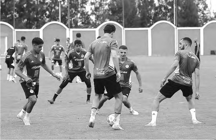
أبرزهم الدولي الجزائري رياض محرز. للتأهل.

يحل، هذا السبت، أشبال الناخب الوطني بالعاصمة الكاميرونية، تحسبا للمواجهة المرتقبة أمام منتخب أوغندا، يوم 18 جوان الجاري، التي ستقام على أرضية ملعب جابوما، وهذا لحساب الجولة الخامسة من التصفيات المؤهلة لكأس أمم إفريقيا المقرر إجراؤها خلال السنة المقبلة بكونت ديفوار.