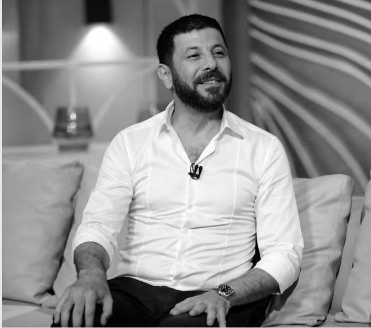
الفنانين، والمسلسل من تأليف منى الشيمي، وإخراج مريم أبو عوف،

أضاف إياد نصار، خلال مقطع فيديو نشره عبر حسابه الشخصي على موقع إنستغرام: "أنا أشفق على الممثلة، وأحترم الممثلة أكثر من الممثل الرجل، في مجتمعنا التي تختار هذه المهنة رغم كل شيء ورغم كل الصعوبات، اختارت مهنة ليست سهلة".