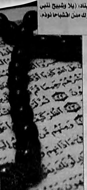
اكن اواشا المند بونشتاك ايلان يمدوكاليس اترند اوحتوند اين

اشخدم ذ يال ونم فصحان الان اصوضند يال ابن اشخدم امك يلا يتاغ لوضو امك يلا يتزلا امك يلا اتدو. دشو افلا- اشدم افوخاميس امك افلا يتعمال اخديميس ذبال- ثوتسرات يعنان - الفثودرت اينس- فلاس ذزاليت ذ سلام ارب اويبا ذاشخدم اينس اودرند السيرة اينس- يذسن امك افلا اتكاسن اودم املحان ذواوال ازيضان اويال يذسن ذاحنينان اويبا ذعداوان اينس اودرند اكن يال ذوين افلهان غس ما ابهان مدن اد شبون ذفس اور ازميرن اذ اوضن اريسيوي- نغ ليغي انسن- امي رب اعليت امانيس ذوين اف كلن ف ترهبا- اكان- ذ لخلق- ثغروين- اينس رب سبحانو اس يمانيس يورثيد ذي لقران اويناد افواليس ويشكرثيد اس واذاليس امي ادينا- اذدينا- افلكيد ذوين افلان ايسعا ثغروين افسوان ذو بريذا اقلهان.