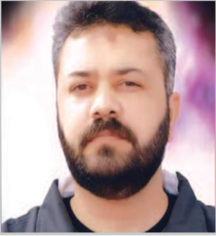
بقلم الأسيران: ياسر أبو بكر ومراد حميدان