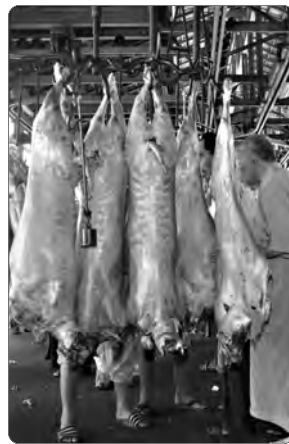
تتأهب المذابح الأكثر تداولاً بالعاصمة لاستقبال عيد الأضحى المبارك، حيث اتخذت كل الإجراءات والتدابير بمذبحي اولاد قايت والحراش

وتم توفير جميع الشروط لاستقبال الأضاحي يومي العيد وضبط كل الأمور المتعلقة بالمذبح والسلخ. علما أن المذابح ستفتح في ساعات مبكرة يومي العيد لتسهيل العملية على الجميع.