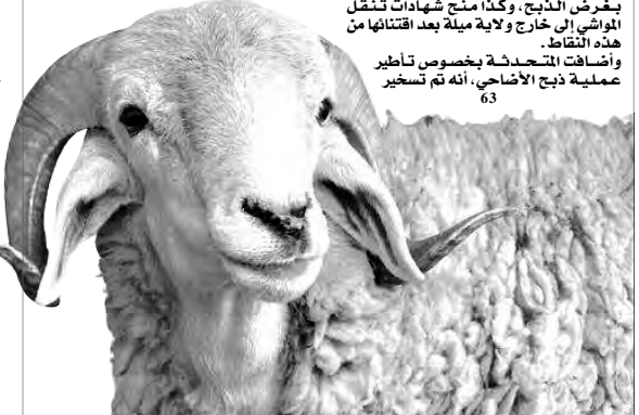
وأضافت المتحدثات بخصوص تأطير عملية ذبح الأضاحي، أنه تم تسخير 63