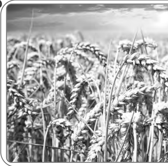
من مقالات عبد الدائم كحيل