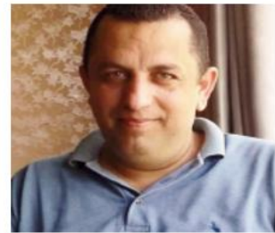
يقلم: إسماعيل جمعه الريماوي

فلسطين عن وعي الشعب الجزائري من جماهير كره التقدم إلى شعارات الثورة في الحراك الشعبي، وقبلها بنادق الثوار على جبهات القتال منذ العام 1948. وفي الوقت الذي تسارع فيه بعض الأنظمة العربية للتطبيع مع إسرائيل، في موجة مترامنة من الكيان الصهيوني لتصفية القضية الفلسطينية، جذدت الجزائر حكومة وشعباً وموقفها الراسخ الداعم لفلسطين ونضال شعبها من أجل الحرية والاستقلال. ورغم وقوع الجزائر سابقاً تحت الاستعمار الفرنسي لم يتخلف الجزائريون عن الالتحاق بالمتطوعين العرب على أرض فلسطين من أجل مقاومة العصابات الصهيونية عام 1948. كما ذكرت مصادر تاريخية أن المئات من الجزائريين انتحروا بالثورة الفلسطينية نهاية الثلاثينات والتي قادها الشيخ عز الدين القسام ضد الاحتلال البريطاني. فلم يتوقف الدعم الجزائري للثورة الفلسطينية منذ استقلال الجزائر، حيث احتضنت عددا كبيرا من الضحايا الفلسطينيين بعد احتلال بيروت عام 1982. ومنها اعتقد المجلس الوطني الفلسطيني، حيث أعلن الرئيس الراحل ياسر عرفات ف 15 نوفمبر/ تشرين الثاني 1988، بقصر الصنوبر بالعاصمة الجزائرية، قيام دولة فلسطين وعاصمتها القدس فيما يسمى فلسطينيا بإعلان الاستقلال. ويرغم الانكسار والتخاذل العربي تجاه فلسطين بقيت الجزائر دوماً تسير على مبادئ ثورتها الجيدة ونهج قادتها العظام، وفيه لعروبتها وقضيتها المركزية فلسطين، ولم يسجل عليها يوماً، أنها تخلت عن دورها التاريخي تجاه فلسطين وقضيتها، فكانت في كل الأوقات والأزمات، خير سند للشعب الفلسطيني في