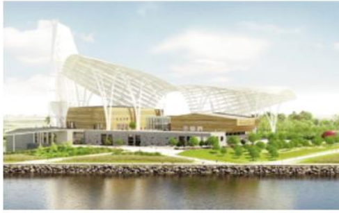
الثقافي الالامادي في إفريقيا، سنة 2018، يمكن اعتبار افتتاح هذا المشروع، المتحف الإفريقي الكبير، بمثابة خطوة جديدة نحو تجسيد التزامات

الجزائر على المستوى القاري في مجال الحماية والحفاظ على الثقافة و التراث في القارة الإفريقية، حيث توفر للمختصين والباحثين في مجال التراث في إفريقيا، أول متحف قاري بهذه الأهمية والمكانة. يذكر أنه خلال اجتماع وزراء الثقافة للدول الأعضاء في الاتحاد الإفريقي، المنعقد في الجزائر سنة 2008، وبعد اقتراح الجزائر لإنشاء "متحف الجزائر الكبير" آنذاك، تم تبني هذه المبادرة بـ"كثير من الحفاوة والترحاب مع إعادة تسميتها بـ"المتحف الإفريقي الكبير". وقد وفرت الحكومة الجزائرية منذ 2009 الأرضية اللازمة لإنجاز هذا المشروع (أكثر من 42 ألف متر مربع، كما اقترح مشروع تصميم هندسي، قبيل أن يقرر الاتحاد الإفريقي تسجيله في جدول الأعمال الخاص بقطاع الثقافة أفاق 2063.