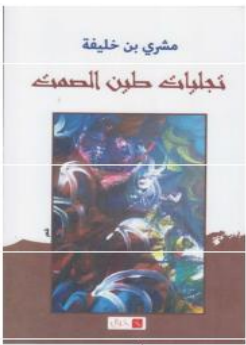
على أشواق الشوق نلتقي في نقطة ضوء وفي وجع الرؤيا (الديوان: ص: 9، 10)

أصبح على بابك أحبك أصبح، أحبك (الديوان، ص: 6) ويقول في قصيدة أخرى: أصبح على بابك أهواك فكثيرا ما نجد الخطاب موجها إلى