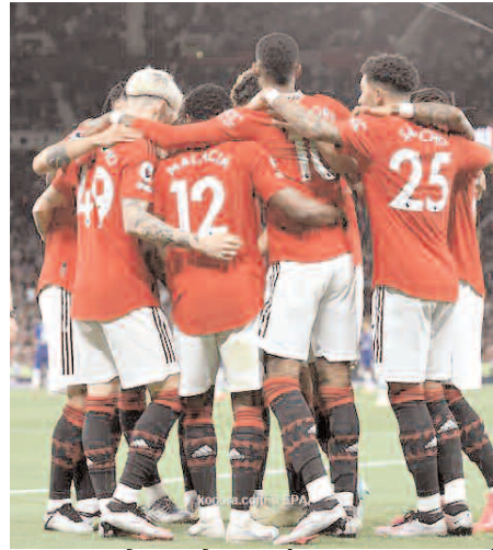
أفاد تقرير صحفي إنجليزي، أمس الأحد، باقتراب عائلة «جليزر» المالكة لمانشستر يونايتد، من حسم

موقفها، بشأن بيع النادي الإنجليزي. وأعلنت عائلة «جليزر» في نوفمبر الماضي انفتاحها على بيع مانشستر يونايتد، بعد حالة الغضب الجماهيري ضد ملك النادي، بسبب تراجع النتائج خلال آخر 10 سنوات. وبحسب صحيفة «ديلي ميل» البريطانية، فإن قرار بيع مانشستر يونايتد من المتوقع أن يصدر في وقت لاحق من هذا الأسبوع. وتتصدر مجموعة «إينوس» التابعة للملياردير البريطاني السير جيم راتكليف، وكذلك المجموعة القطرية بقيادة الشيخ جاسم بن حمد آل ثاني، قائمة المتقدمين لشراء مانشستر يونايتد. وأوضحت الصحيفة، أنه رغم أن العرض المقدم من مجموعة جيم راتكليف، كان هو المنتصر والأقرب للاستحواذ على نسبة كبيرة من مانشستر يونايتد، لكن هناك تحول درامي فيما يخص العرض القطري، قد يجعل الكفة تميل للشيخ جاسم.