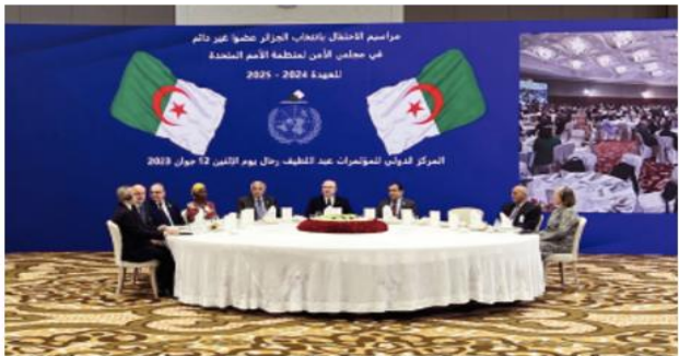
مراسم الاحتفال بانتخاب الجزائر عضوا غير دائم في مجلس الأمن لمنظمة الأمم المتحدة للفترة 2024 - 2025

شروطة وحتمية تكريس حق جميع الشعوب في الحرية وحق جميع الأمم في الأمن والأمان وحق جميع الدول في السيادة وفي صنع قراراتها بذاتها وتبني سياساتها بأيديها. كما جدد التعبير، باسم رئيس الجمهورية، عن عظيم الشكر والعرفان لكل من الاتحاد الإفريقي وجامعة الدول العربية ومنظمة التعاون الإسلامي على تبنيها لترشح الجزائر. ولفت إلى أن انتخاب الجزائر جاء هذه المرة بدينامية خاصة. واصفا بإسهامه بالاحتفال الذي يكرس الرؤية المتبصرة للسيد رئيس الجمهورية ويجسد المشروع الطموح الذي يادر به لتعزيز دور بلادنا على الساحة العالمية وتجديد مساهماتها كقوة فاعلة من أجل السلم والأمن والاستقرار. وكشريك ملتزم يتحمل قسطه من الجهود الرامية لمواجهة التحديات والأعباء التي يفرضها رهن منظومة العلاقات الدولية.