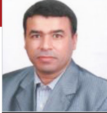
بقلم عبد القادر رالة

اعذرني إذ أنا تلصصتُ عليك! وفي الحقيقة إنني أتعجب لأنك تحن إلى ذلك البيت بذلك الشكل المحزن، فالناس في رحله دائمة من بيت قديم إلى آخر جديد، ومن طبع الإنسان أن يفرح لما ينتقل إلى بيت جديد يمكنه، إلا أنت فانك شعرت بالخزن وأنت