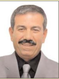
■ بقلم: حمادة فراغنة

مندهش، مصدوم، مقهور من الصمت الإسلامي على ما يجري في القدس، المدينة العربية الإسلامية المقدسة كما هي مكة المكرمة والمدينة المنورة.