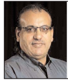
■ بقلم: أمجد عرار

وحين دخل فلاديمير بوتين البيت الأحمر في موسكو قداماً من عالم المخبرات السوفييتي، تأكدت للمتابعين الموضوعيين مقولة أن «لكل دولة زمان ورجال»، إذ لم يكن التغيير القيادي تغير وجوه أو أشخاص، بل كان تغييراً جذرياً وبأدوات مختلفة تماماً. وكان بداية الطريق - المعركة لإعادة هبة روسيا التي كانت العمود الفقري للاتحاد السوفييتي، ولم تكن مجرد واحدة من خمس عشرة جمهورية. وهنا يجب أن نتأكد وتندكر بأن الدولة العظمى لا تحمل هذه الصفة ارتباطاً بامتلاك الأسلحة التقليدية والنووية، بل لها مقومات تاريخية واقتصادية وسياسية وثقافية، وغيرها، وكل ذلك مجتمعاً.