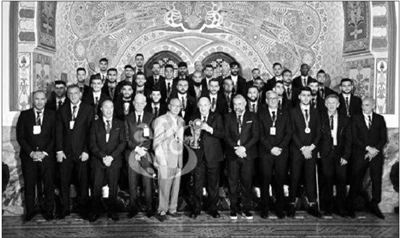
■ سمير ب.

أشرف رئيس الجمهورية، السيد عبد المجيد تبون، أمس بقصر الشعب بالجزائر العاصمة، على حفل تكريم نادي اتحاد الجزائر العاصمة المتوج بكأس الكونفدرالية الإفريقية (كاف) لكرة القدم 2022-2023.